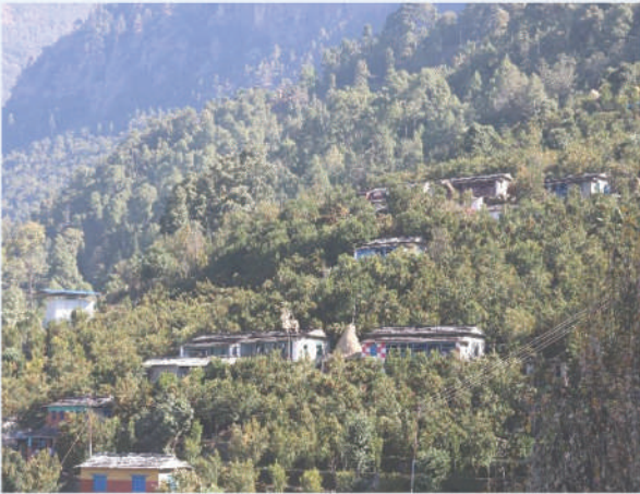
सुन्तलाको रमणीय बगान पर्वतको बाँसखर्क