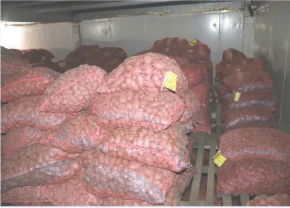
Cold Store भित्र आलु बीउ सङ्कलन, डडेलधुरा