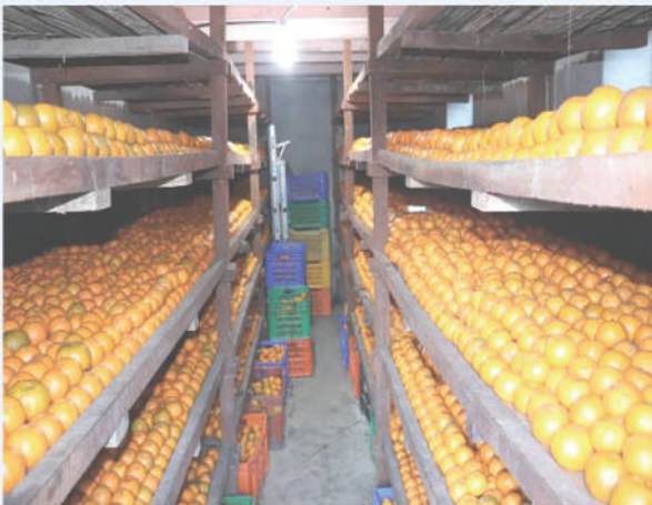
रष्टिक स्टोरमा सुन्तला, बिहुँ, बागलुङ