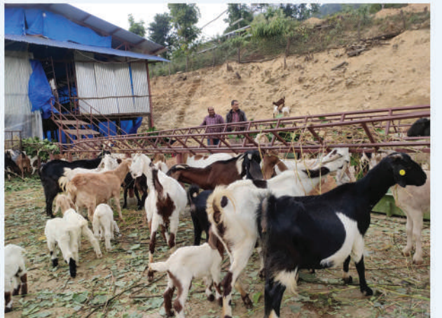
व्यवसायिक बाख्रापालन, अर्घाखाँची