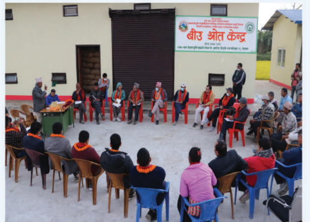
बिउ स्रोत केन्द्र स्थापना कुमरोज, चितवन