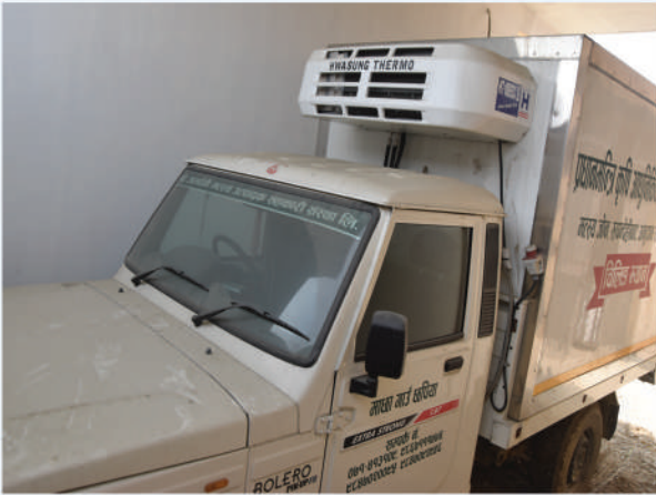
दुवानीका लागि अनुदानमा चिलिङ भ्यान वितरण