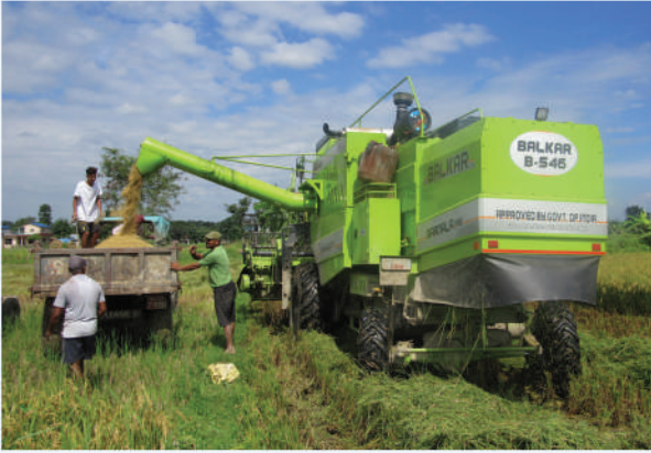
कम्बाइन हार्भेष्टरको प्रयोग गरी चैते धान कटानी, चितवन