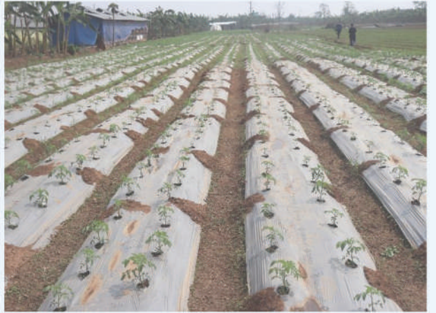
प्लाष्टिक मल्लिचडमा भण्टा खेती, नवलपुर