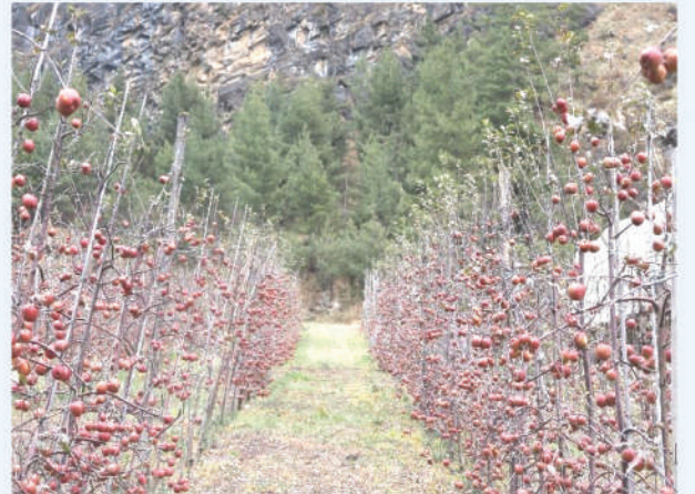
उच्च घनत्व प्रविधियुक्त स्याउ खेती मनाङ