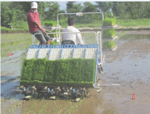
मेसिनबाट चैते धान रोपाइ, कुमरोज, चितवन