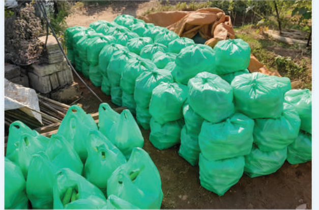
बजारीकरणका लागि काँक्रा प्याकेजिङ नवलपुर