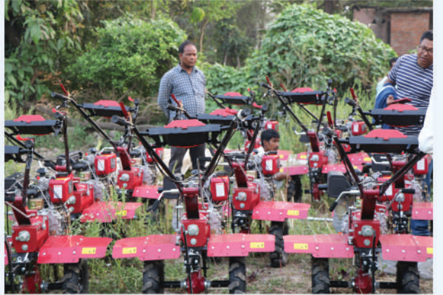
ब्लक विकास कार्यक्रम अन्तर्गत हाते ट्याक्टर वितरण कार्यक्रम, कैलाली